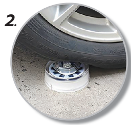
2. รับน้ำหนักได้มากถึง 20 ตัน