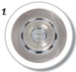
1. โคมกระจก ทำจาก กระจกโพลีคาร์บอเนต แข็งแรง ทนทาน