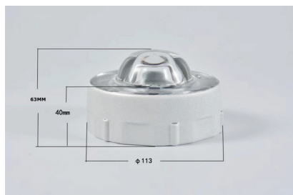
กว้าง \phi 11.3 cm ความสูงรวม 6.3 cm. ความสูงสำหรับฝังพื้น 4 cm.