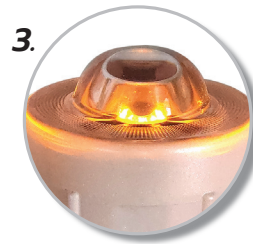
3. ไฟ LED 6 หลอด ทำงานอัตโนมัติในเวลากลางคืน